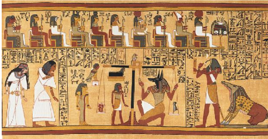
Fragmento del Libro de los Muertos. Papiro de Ani