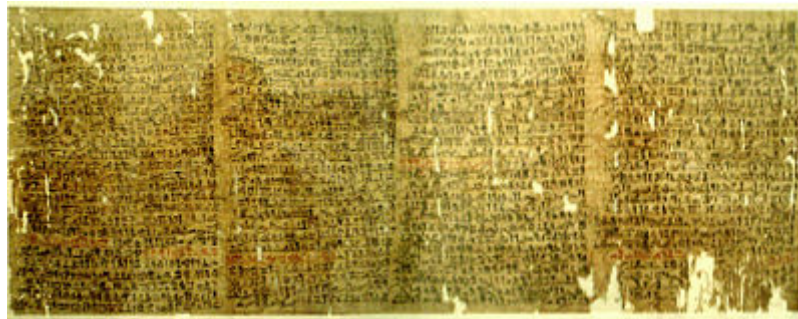
Fragmento del Papiro Westcar. Altes Museum, Berlin.

También existe una amplia colección de papiros con textos técnicos y médicos, como el Papiro Kahun sobre matemáticas, aunque los hay de literatura pura, como el Papiro Westcar que contiene una colección de cuentos de la Dinastía IV. Los autores de la literatura de los Imperios Antiguo y Medio (mediado el segundo milenio adC) parecen haber sido una élite de la clase administrativa, y fueron celebrados en el Imperio Nuevo (al final del segundo milenio).