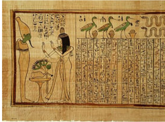
Libro de los Muertos, de Nany: versión tebana.