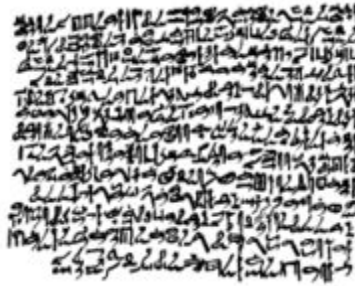
Papiso Prisse. Museo del Louvre.

También existe una amplia colección de papiros con textos técnicos y médicos, como el Papiro Kahun sobre matemáticas, aunque los hay de literatura pura, como el Papiro Westcar que contiene una colección de cuentos de la Dinastía IV. Los autores de la literatura de los Imperios Antiguo y Medio (mediado el segundo milenio adC) parecen haber sido una élite de la clase administrativa, y fueron celebrados en el Imperio Nuevo (al final del segundo milenio).