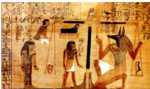
Capítulo 125. Libro de los Muertos. Papiro de Ani

Quizás el capítulo más famoso e importante del Libro de los Muertos sea el titulado "Fórmula para entrar en la sala de las dos Maat", en el cual el difunto se presenta ante el tribunal de Osiris al objeto de que se pese su corazón (conciencia y moralidad) y superada la prueba pueda continuar su camino, en el mundo de los muertos, hasta alcanzar los fértiles campos de Aaru.